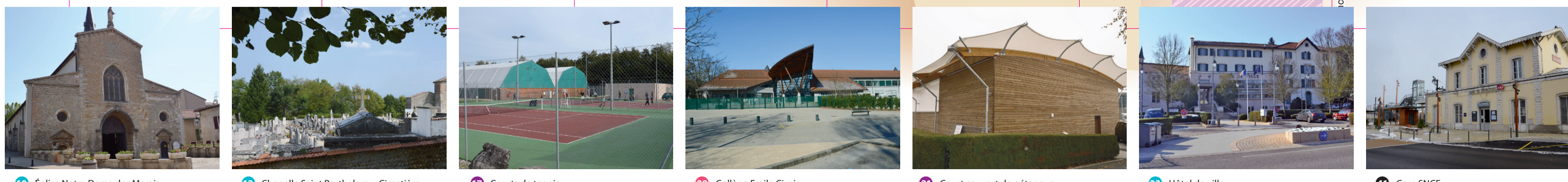
10 Église Notre Dame des Marais 12 Chapelle Saint Barthelemy - Cimetière 17 Courts de tennis 29 Collège Emile Cizain 31 Court couvert de pétanque 33 Hôtel de ville 41 Gare SNCF